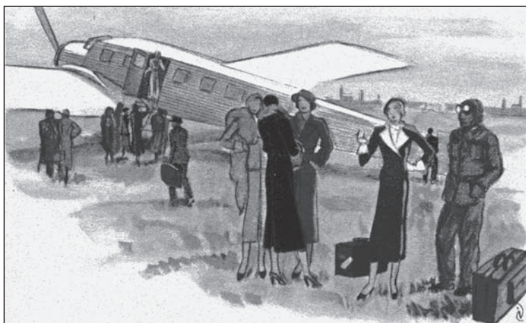
Figura 1 TAMPOCO EL CIELO ERA UNA FRONTERA PARA LOS VIAJES FEMENINOS