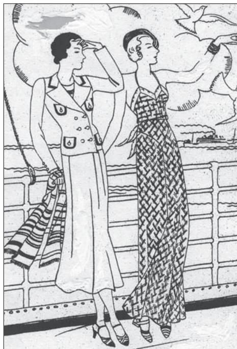
Figura 3 ELEGANCIA A BORDO DEL BARCO

Las prendas eran en su mayoría muy clásicas compuestas principalmente por trajes de saco y pollera, faldas y blusas. La diferencia básica se observa en los accesorios: sombrero y guantes para el viaje en tren, medias de lana para el avión, pañuelos para el cuello y cartera con almohadoncito para el viaje por mar, una manta liviana pero abrigada más un turbante y pañuelo al tono para el automóvil. Para los cruceros estaba permitido el pijama de piernas muy anchas que más bien asemejaba una falta pantalón tal como se observa en la Figura 3.