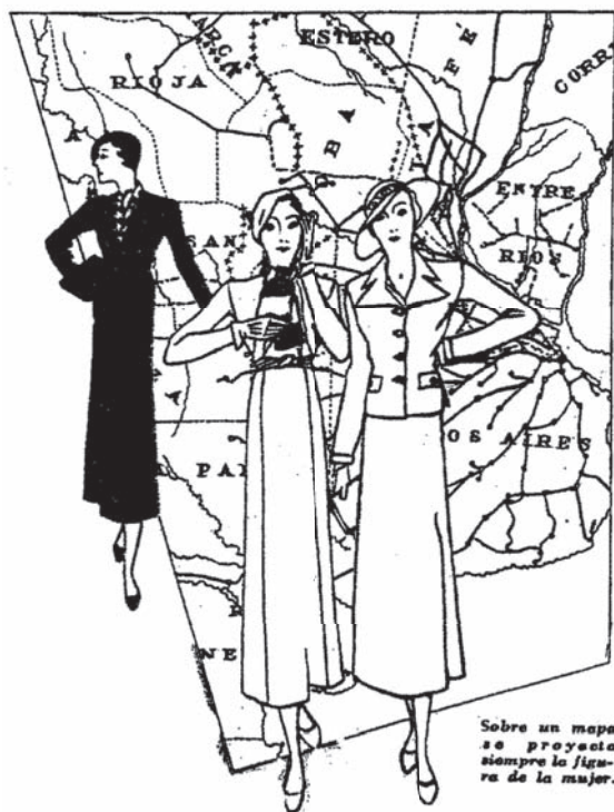
Figura 2 SIN LÍMITES PARA EL TURISMO FEMENINO

Si bien todo lugar era apto para el turismo femenino como reza el pie de la Figura 2, fueron las playas las que ofrecían la mayor atracción.